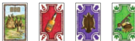
carte commerciante + merci