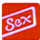
Sesso / Bambino